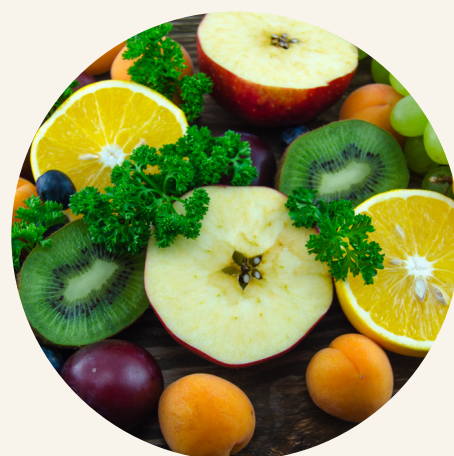
Фрукты и овощи