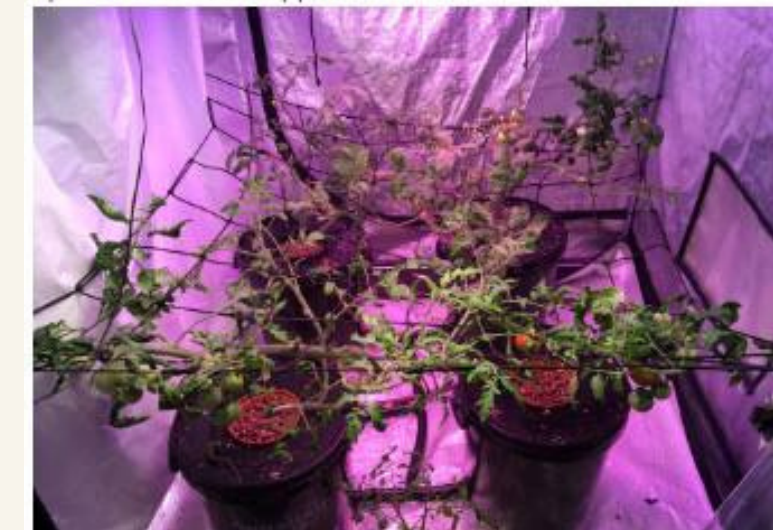
Уровень \text{CO}_2 – 400 ppm