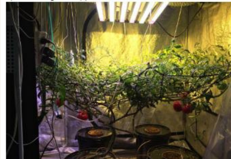
Уровень \text{CO}_2 – 400 ppm