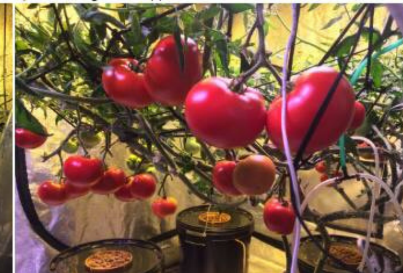
Уровень \text{CO}_2 – 1253 ppm