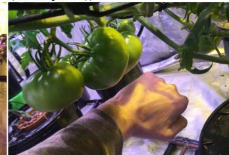
Уровень \text{CO}_2 – 1078 ppm