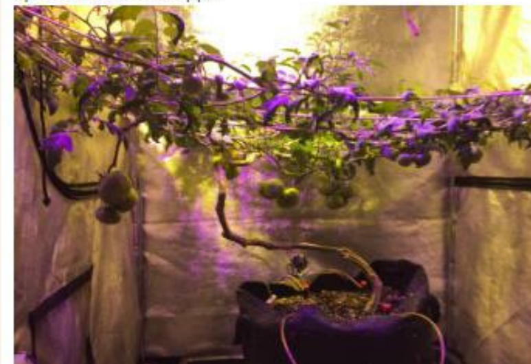
Уровень \text{CO}_2 – 400 ppm